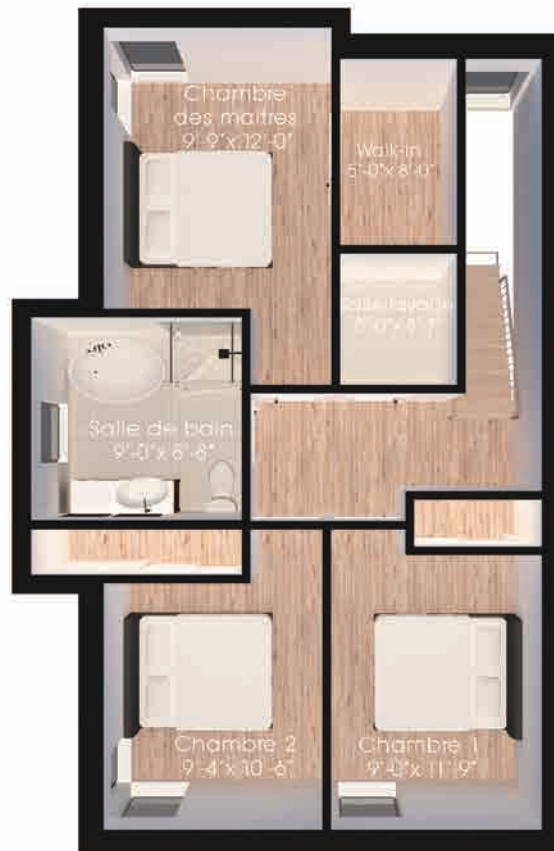
Plan du 2 e étage