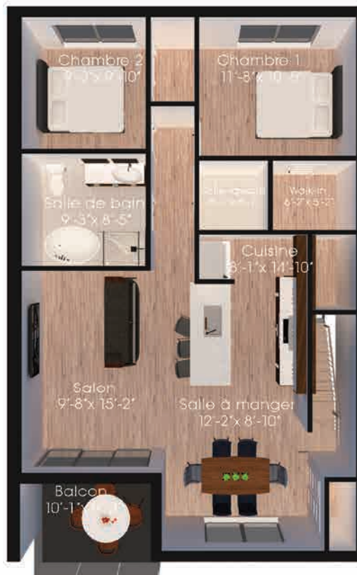
Plan du 2 e étage