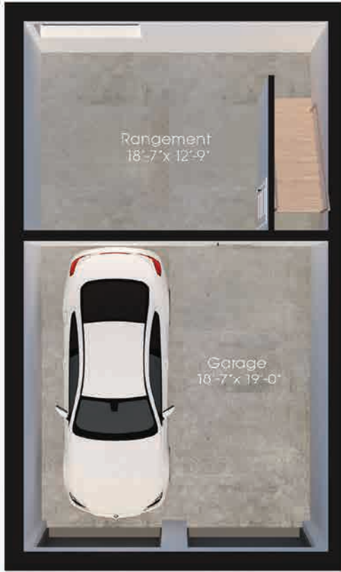
Plan du sous-sol