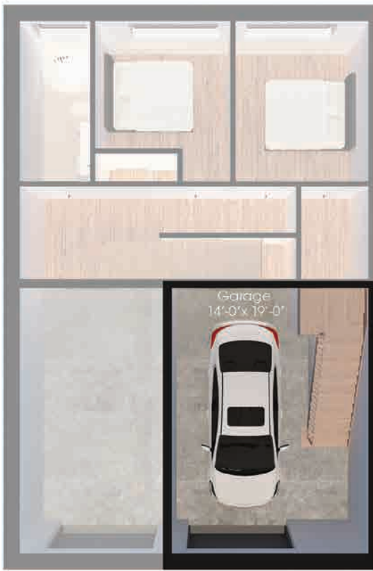
Plan du sous-sol