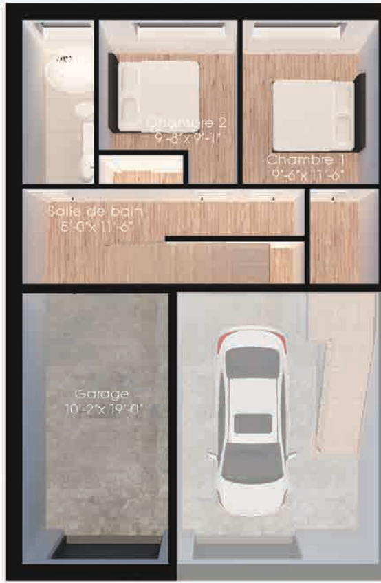
Plan du sous-sol